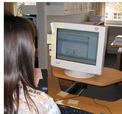
Grontmij | Carl Bros affaldsplanværktøjer hjælper dig igennem affaldsplanlægningens faser og sikrer det løbende overblik over affaldsmængderne i kommunen.

Sidste skud på stammen af webbaserede affaldsplanværktøjer er en model, som beregner de økonomiske og miljømæssige konsekvenser ved valg af givne affaldsordninger. Dette værktøj kan hjælpe kommunerne med at få et overblik over, hvilke omkostninger og miljøkonsekvenser der er ved de forskellige affaldsordninger.