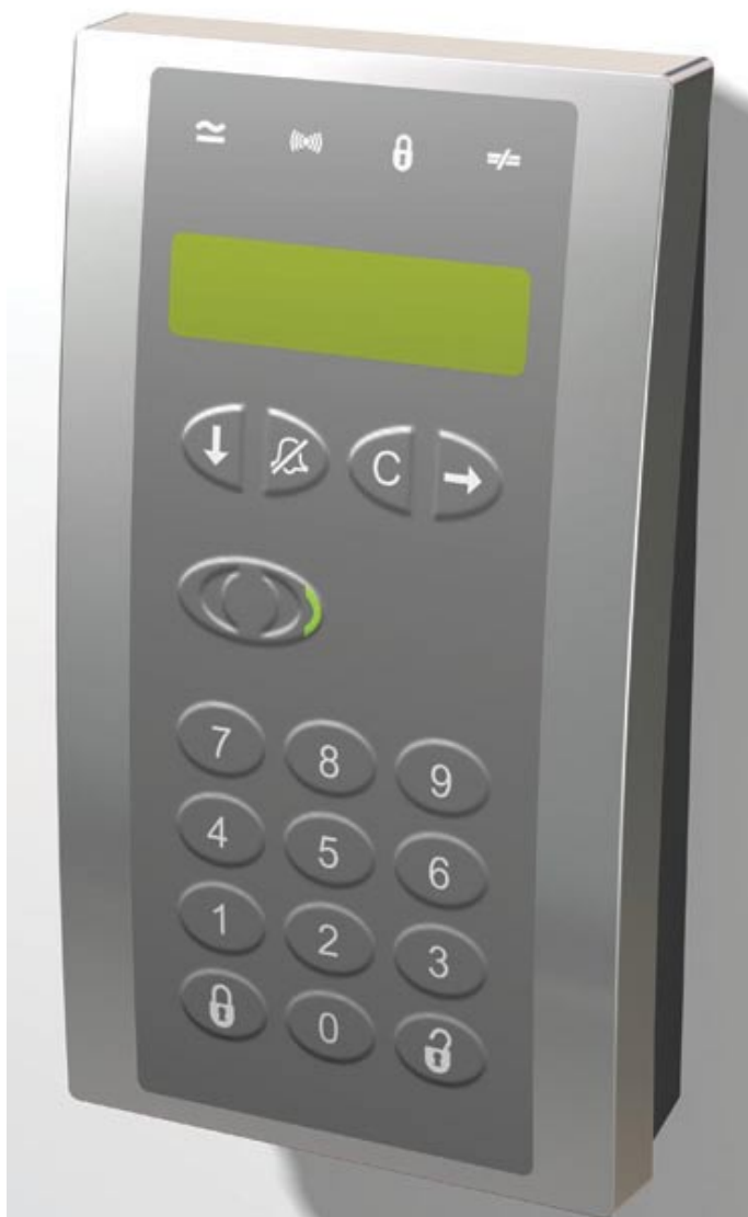
Udviklingsafdelingen har for en kunde designet og konstrueret en afløser for et af kundens produkter - en adgangsterminal

MERE INFORMATION LASSE HALD, AFDELINGSCHEF LHD@CARLBRO.COM