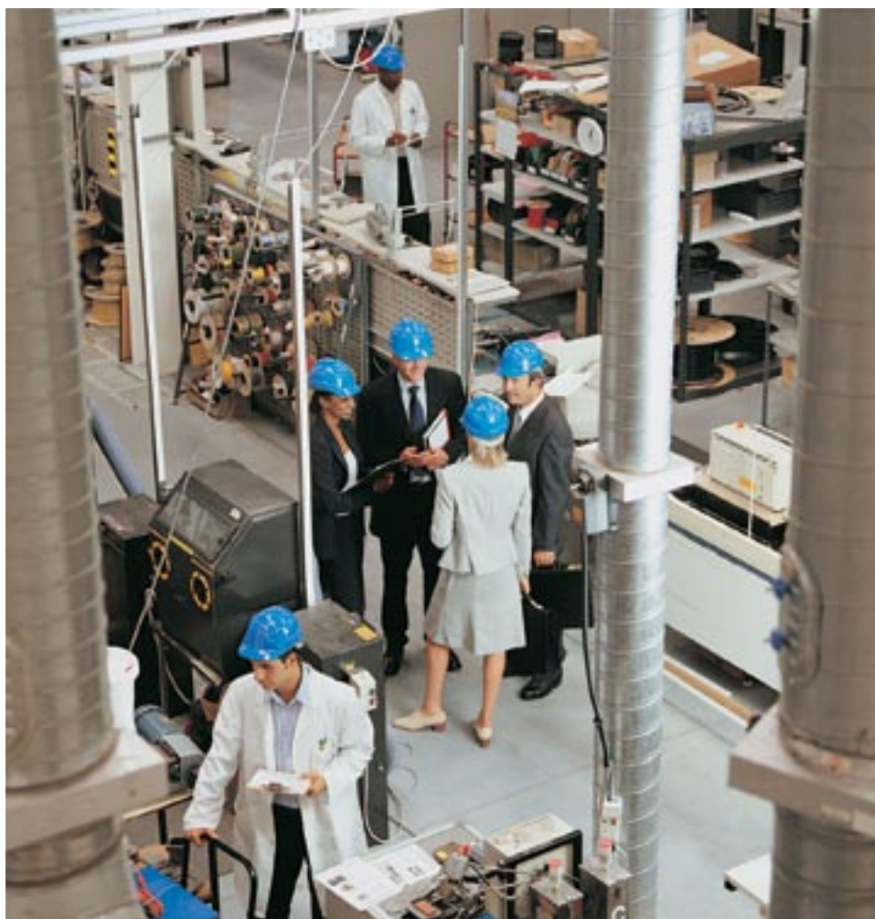
Carl Bro Industri leverer et bredt spektrum af ydelser i forbindelse med nyetablering af fabrikker og omstrukturering eller opgradering af eksisterende produktionsfaciliteter.