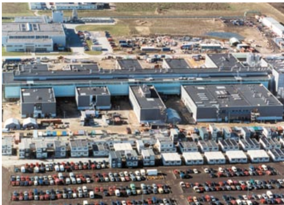
Carl Bro Industri rådgiver om produktionsprocesser lige fra udarbejdelse af et nyt koncept til projektering, implementering og tilsyn med både små og store produktionsanlæg.

Vores rådgivning bygger på en kombination af mange erfaringer og ydelser, og når vi støder på områder, der vedrører eksempelvis effektivisering, miljø, støj, spildevand eller bygningsteknik, kan vi med kort varsel trække på Carl Bro Gruppens store netværk af kompetencer.