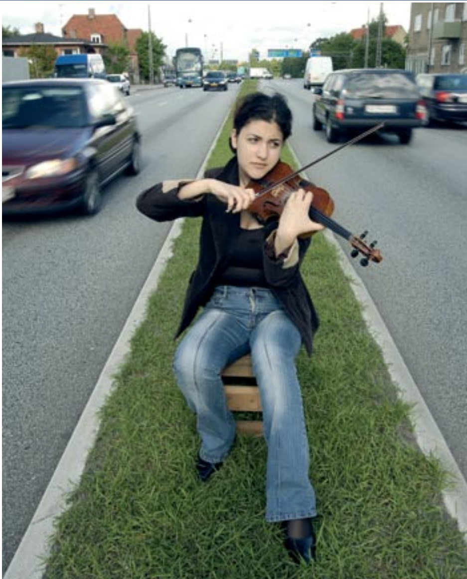
Acoustica har mere end 20 års erfaring med løsning af støj- og vibrationsopgaver for offentlige og private kunder.