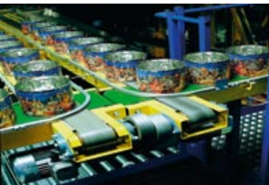
Glud & Marstrand, der hvert år producerer 70 mio. runde kagedåser, har haft stort udbytte af due diligence processer.

Nordens største producent af metalemballage Glud & Marstrand har fuldt overblik over sine miljøforhold som følge af miljømæssige due diligence audits gennemført med Carl Bro Gruppens bistand.